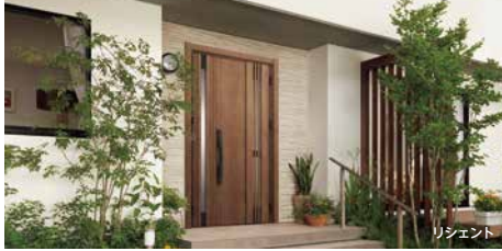
※商品画像はイメージです