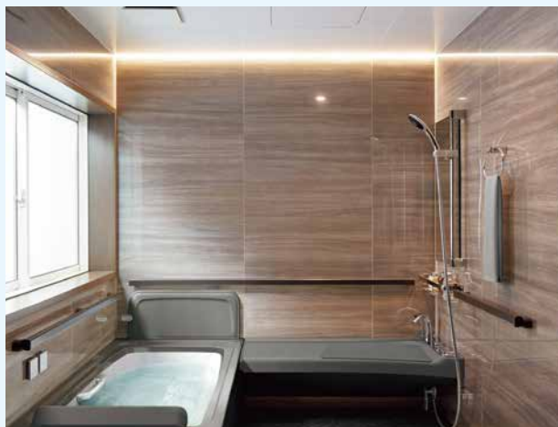
※商品画像はイメージです