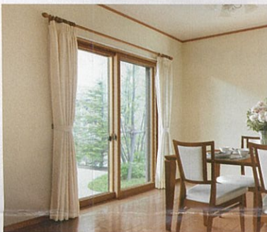
断熱内窓 (二重窓) インプラス

今ある窓の内側に新しい窓を取付けるだけ。1窓最短1時間のスピード施工で断熱性がアップして、結露も軽減します。