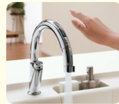
エコセンサー付 A9タイプ ナビッシュハンズフリー ナビッシュ