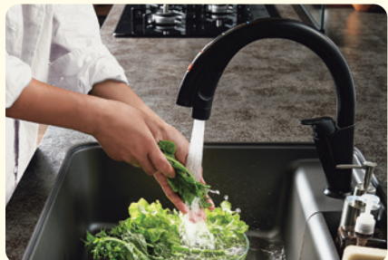
浄水器ビルトイン型ブラックA109タイプ ナビッシュハンズフリー