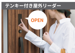
テンキー付き屋外リーダー