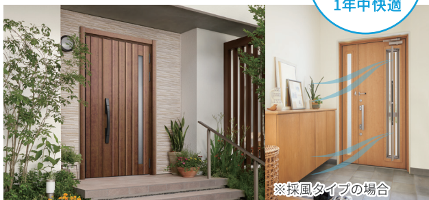
※採風タイプの場合