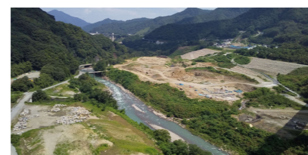
ハツ場ダム建設地(令和元年8月)