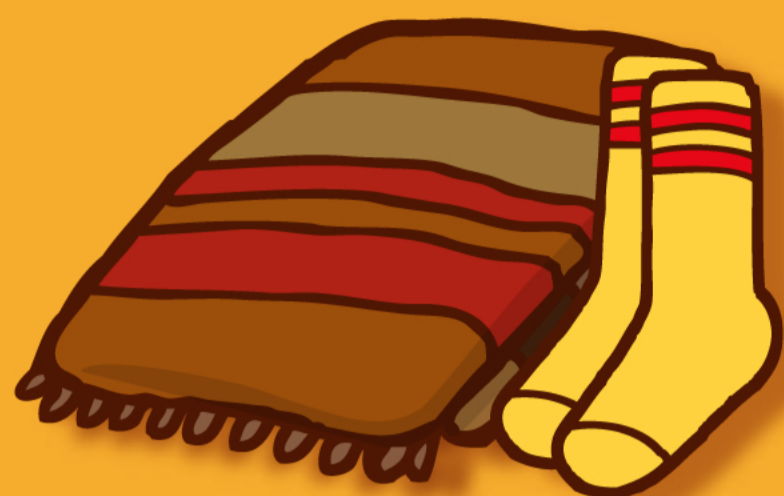
特に冷えやすい首まわりや 足もとをあたためよう