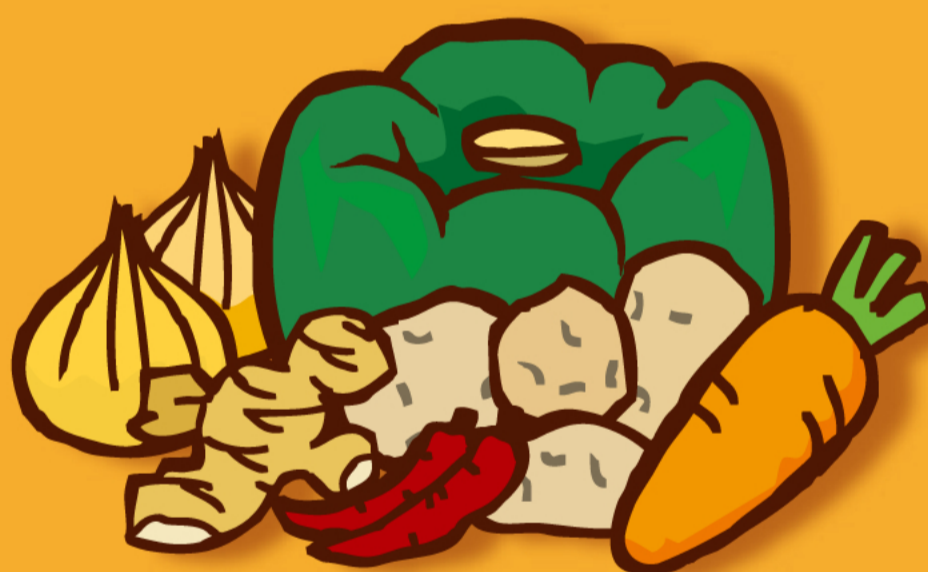
根菜や香辛料など、 体をあたためる食材をとろう