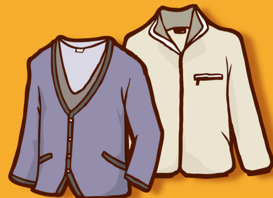
動きやすくあたたかい 室内着を活用しよう

WARMBIZ(ウォームビズ)とは、寒い季節でも暖房に頼り過ぎないで快適に過ごそうという取組。寒い時は一枚多く着る、温かいものを飲むなど、ちょっとした工夫で、20°C(目安)の室内で快適に過ごすことができます。地球温暖化対策のため、暖房時のエネルギー使用量とCO 2 発生量を削減して、地球に、みんなに、やさしい冬にしましょう。