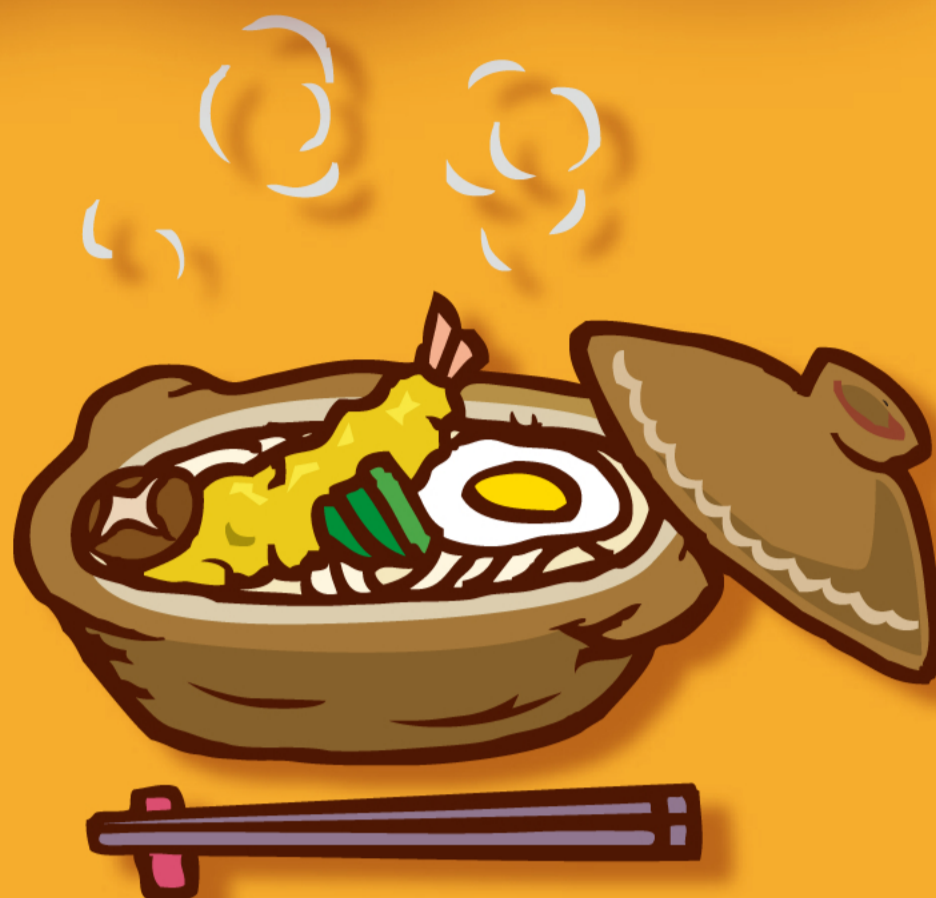
煮込み料理などを食べて 体をあたためよう