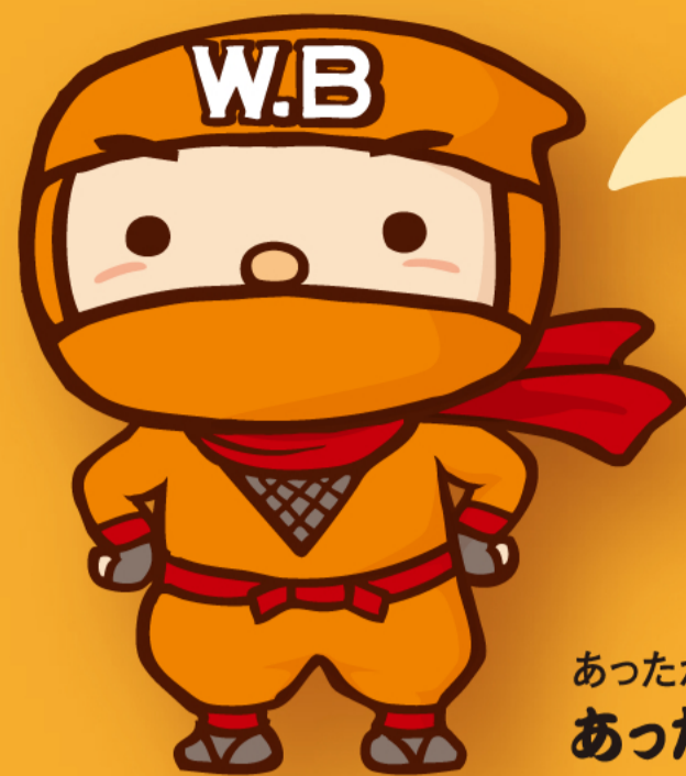
あったか忍者 あった丸