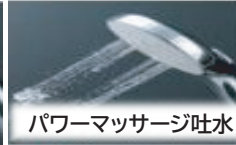
パワーマッサージ吐水