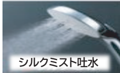
シルクミスト吐水